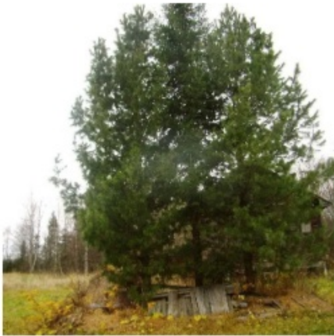
«Кедровый сад» (Красноборский округ)