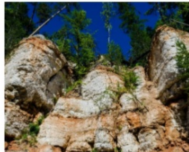
«Голубинский карстовый массив»

Самые известные памятники природы на территории нашей области, это «Урочище «Куртяево» и памятник природы «Голубинский карстовый массив» (Пинежский район).