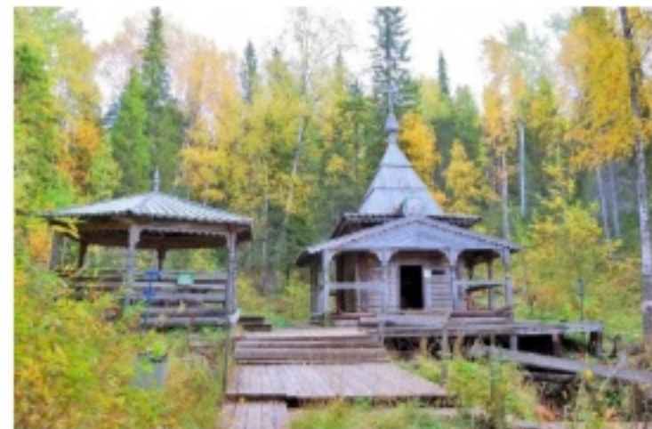
Памятник природы "Чурозеро" (Красноборский округ)

Памятники природы - уникальные, невозполнимые, ценные в экологическом, научном, культурном и эстетическом отношении природные комплексы, а также объекты естественного и искусственного происхождения.