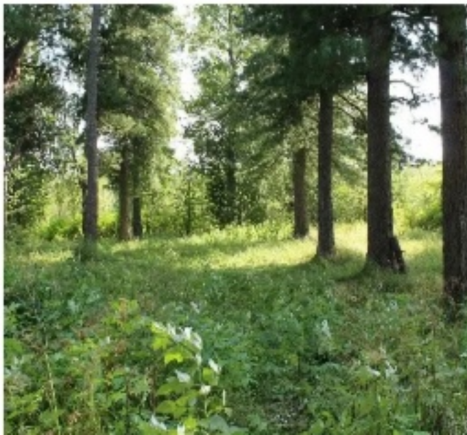
«Кедровый сад» (Красноборский округ)